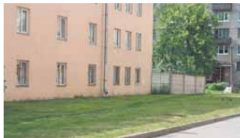
пр. Маршала Блюхера, д. 12