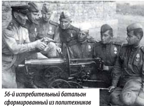
56-й истребительный батальон сформированный из политехников

Но в стенах Ленинградского политехнического института про-