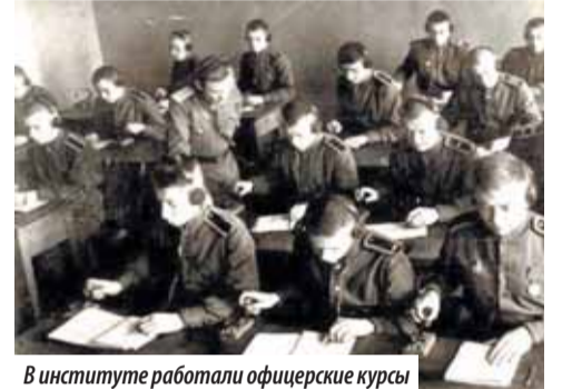
В институте работали офицерские курсы