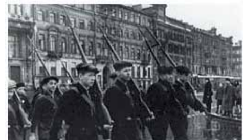
Студенческий отряд ЛПИ на занятиях по военному делу